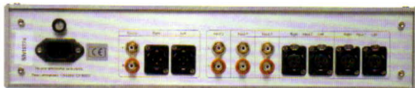
En face arrière, entrées symétriques et asymétriques font jeu égal

contrôle du volume a été singulièrement amélioré. D'abord sur le plan de la convivialité, avec une plage de réglage nettement accrue (variation plus fine grâce à davantage d'incrément), et donc plus précise. Grâce à cette commande de haute précision, le seuil de bruit de fond a reculé significativement, et la précision sur les petits signaux est bien meilleure. Le circuit présente une architecture symétrique polarisée en pure classe A, ce qui implique une évidente influence de la température de fonctionnement, qui, comme vous pouvez vous en douter, grimpe assez franchement. Les composants ont donc été surdimensionnés pour accommoder de façon optimale ce phénomène. Pass précise que la température varie et finit par se stabiliser parfaitement après 24 heures de mise sous tension.